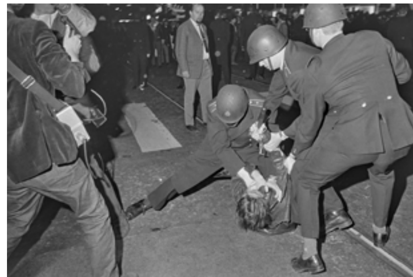
Jeg prøvede at holde mig på afstand af volden, men kan se af min dagbog, at jeg var mere aktiv, end jeg husker. Allerede den 5. maj var jeg trængt ind i Saga Bio ”for at sælge programmer med ’Vietnamfrivillig’ og kom i foyeren i blodigt slagsmål med Vilde engle ... men jeg kom i snak med direktøren hvorefter vi blev drevet ud med vold og drevet helt op til Frihedsstøtten ... løb hjem og skiftede tøj og tog maling med i plastikposer for at kravle over en mur ind til biografen ... lykkedes ikke ... ved 12-tiden gik vi hjem for at læse alle aviserne om aktionen.”