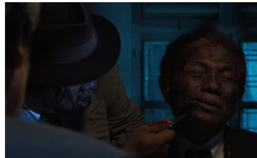
En af de nu gamle bødler viser i filmen, hvordan de torturerede og slog de venstreorienterede ofre ihjel, som amerikanerne havde udpeget for dem.