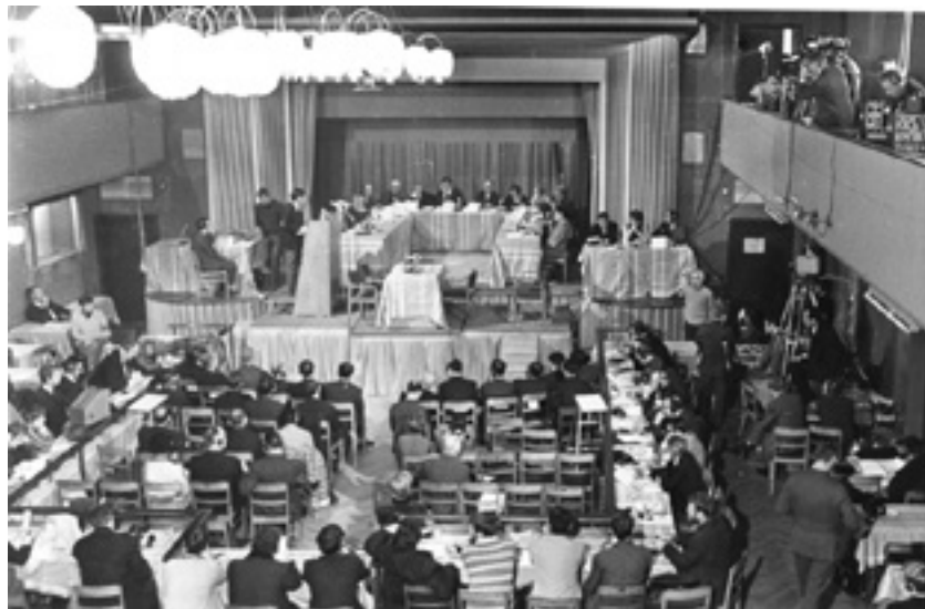
Godt nok kunne jeg huse mange mennesker i mit slumkollektiv i Dannebrogsgade, men ikke så mange som Fjordvilla. Grin bare.