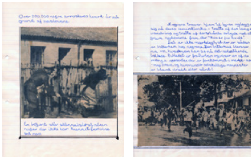
Avisbilledet til venstre var det, jeg fiskede op fra min mors toiletrengøring. I min tidlige skoletid var jeg langt mere påvirket af apartheidregimets grusomheder i Sydafrika end den lidt mildere version i USA.